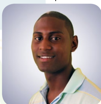
Meester Shelemaih Lichamelijke Opvoeding