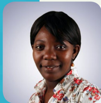
Juf Achnasja Groep 5